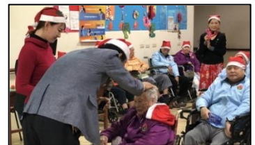
聖誕節時拜訪安養中心